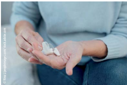
Bei Krebspatientinnen und -patienten ist eine Polymedikation häufig. Apothekerinnen und Apotheker erläutern den Patientinnen und Patienten die richtige Einnahme der Medikamente genau und stehen so den Betroffenen bei ihrer Therapie beratend zur Seite.

In der AMBORA-Studie wurde 2022 nachgewiesen, dass sich eine intensiviertere klinisch pharmazeutische/pharmakologische Therapiebegleitung auf Parameter wie Nebenwirkungen, Medikationsfehler und Patientenzufriedenheit positiv auswirkt.