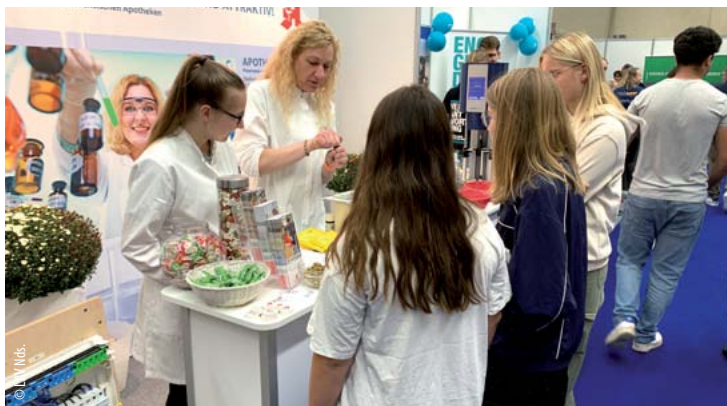
Ob auf Messen oder vor Schulklassen - Anhand von praktischen Aufgaben und eigenen Erfahrungsberichten bringen Apothekerinnen und Apotheker den Schülerinnen und Schülern die drei Apothekenberufe näher.

Im Rahmen des LAV-Nachwuchsprojektes „Apotheker unterwegs in Schulen“ gehen Apothekerinnen und Apotheker mit ihren Teams in Schulen und stellen die drei Apothekenberufe Apotheker/in, Pharmazeutisch-technische Assistentinnen und Assistenten sowie Pharmazeutisch-kaufmännische Angestellte vor. Interessierte Apothekerinnen und Apotheker, die sich im Rahmen des Projekts engagieren möchten, können sich an die LAV-Geschäftsstelle wenden. Kontaktdaten sowie nähere Informationen zum Projekt gibt es auf www.lav-nds.de unter der Rubrik Veranstaltungen.