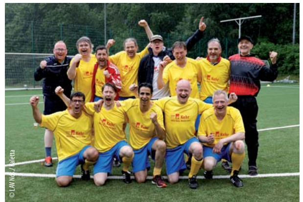
Die Fußball-Teams des LAV freuen sich über Verstärkung, um den Meistertitel der Deutschen Apotheker-Fußballmeisterschaft in 2024 zu verteidigen.

Verteidigung der „Pötte“ – Vom 20. bis 22. September 2024 kicken Apothekerinnen und Apotheker um den Meistertitel der Deutschen Apotheker-Fußballmeisterschaft in Volkach am Main (Bayern). Der Landesapothekerverband Niedersachsen e.V. (LAV) wird mit Junioren- und Ü45-Mannschaften an den Start gehen, um den Meistertitel aus dem letzten Jahr zu verteidigen. Für seine Teams sucht der LAV noch fußballbegeisterte Apothekerinnen und Apotheker zur Verstärkung.