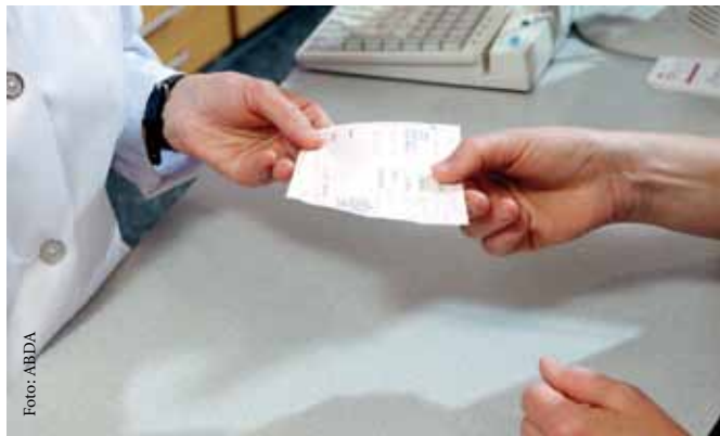
Aus der Klinik mit Rezept in die Apotheke: Die neue Vereinbarung zwischen DAV und GKV-Spitzenverband zum Entlassmanagement soll die Abwicklung von Rezepten, die in Kliniken ausgestellt und von Patienten in der Apotheke eingereicht werden, einfacher gestaltet und Retaxierungen verhindert werden.

• So kann die Apotheke unter anderem das wichtige Kennzeichen „4“ im Statusfeld auf dem Rezept eigenständig ergänzen, wenn es fehlt. Diese Nummer weist die Verordnung als Entlassrezept aus.