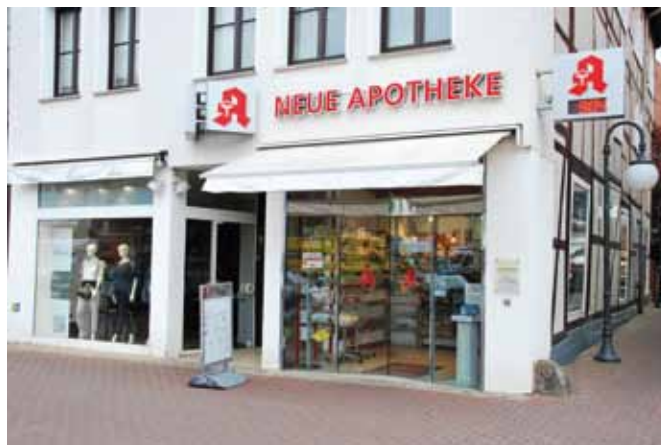
Die „Neue Apotheke“ liegt im Zentrum von Stadthagen und ist für viele Bewohner eine wichtige Anlaufstelle.

Um als Testapotheker durchstarten zu können, musste der Apothekeninhaber für alle Be-