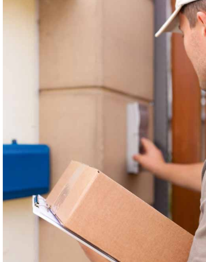
Rx-Versandhandel: Das Verbot oder auch die Begrenzung des Versandhandels mit rezeptpflichtigen Arzneimitteln sind bei einigen Parteien auf der Agenda, um die wohnortnahe Versorgung durch Apotheken vor Ort zu sichern. Einige Parteien lehnen dies gänzlich ab, haben aber kaum alternative Vorschläge.

Zu großen Problemen hat aus Sicht der FDP die Budgetierung im Gesundheitswesen geführt. Sie soll daher abgeschafft werden. Behandlungskosten und Leistungsumfang sollten stattdessen künftig transparenter dargestellt werden und Patienten verstärkt selbst über einzelne Behandlungen entscheiden können, heißt es. „Dazu sollen