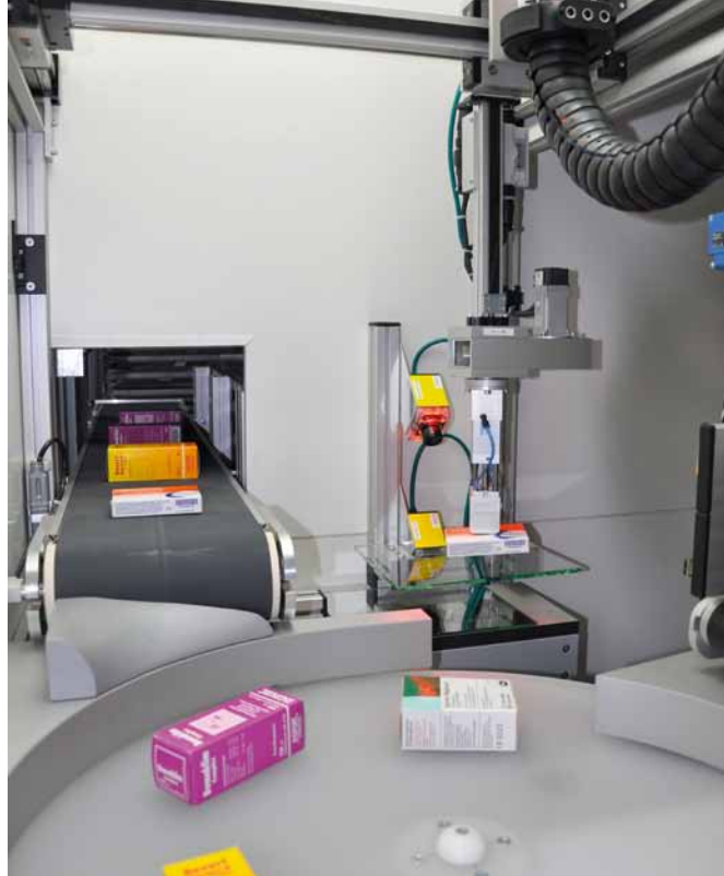
Das sogenannte „KLS Portal“ lagert Arzneimittelpackungen vollautomatisch ein und erfasst deren Verfalldaten.

und so die Lieferfähigkeit der Apotheke zu verbessern. „Wenn sich der Bedarf für bestimmte Arzneimittel zum Beispiel auf-