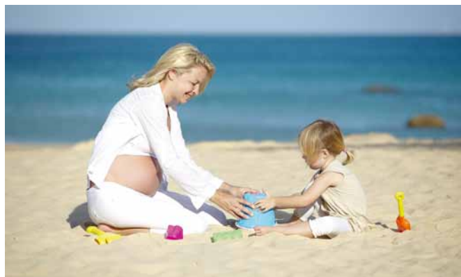
MS-Patient und Kinderwunsch: Die Schubrate nimmt während einer Schwangerschaft häufig sogar ab.

Inzwischen gibt es für die Behandlung der MS zahlreiche Therapieoptionen. Grundsätzlich unterscheidet man dabei die Behandlung eines akuten Schubes von einer Dauerbehandlung mit verlaufsmodifizierenden Medikamenten, die die Zahl erneuter Schübe vermindern soll. Während eines akuten Schubs erhalten die Patienten unabhängig von der Art ihrer MS hohe, pulsatile Dosen eines Cortisons (Methylprednisolon). Als Nebenwirkungen treten dabei häufig erhebliche Schlafstörungen auf, die sich