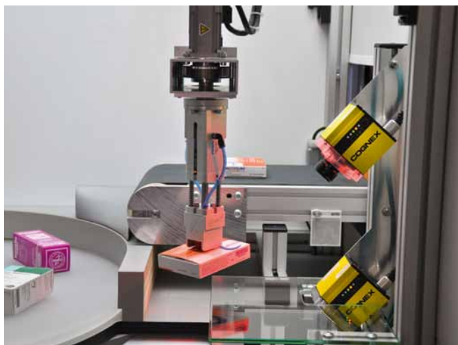
Die automatisierte Einlagerung trägt erheblich zur Zeitersparnis und Optimierung des Warenlagers bei.

Das Team von Leugermann ist erleichtert, dass das Bearbeiten von Lagerlisten entfällt und nun durch den Automaten übernommen wird. „Das schafft neue Zeitfenster, in denen wir mehr Zeit für die Patienten erübrigen können oder die Zeit für Schulungen nutzen können, um unsere Beratung weiter zu verbessern.“ AW