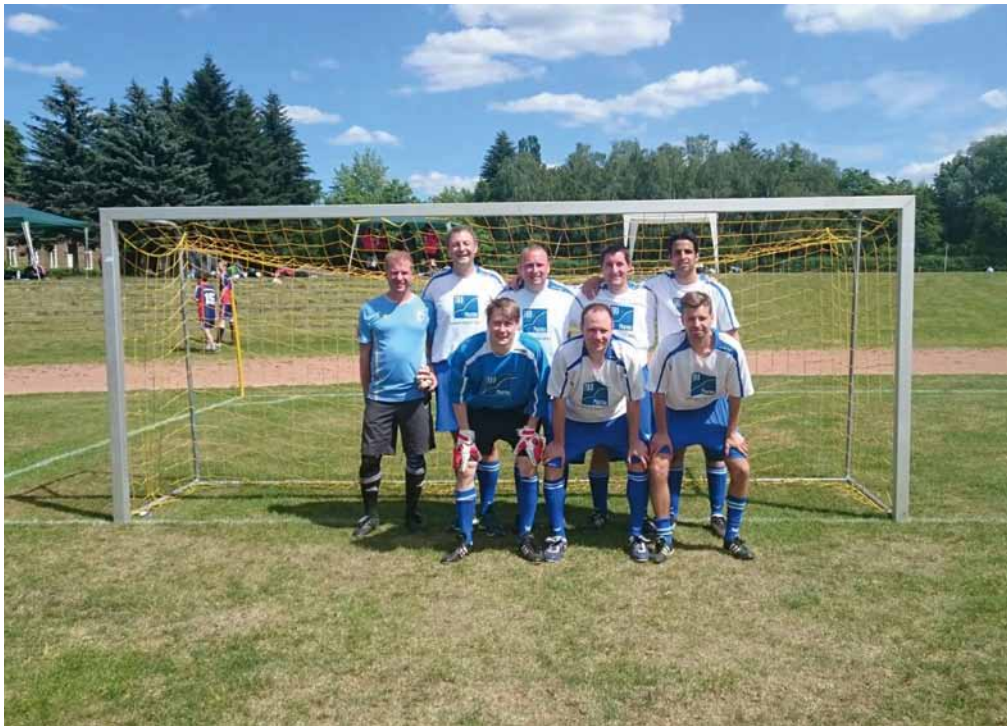
Freute sich über den fünften Platz: Das Team B des LAV-Juniorenteams.