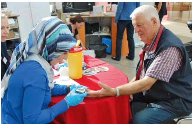
„Und wie sieht es mit Ihrem Zucker aus?“ – Besucher der Auftaktveranstaltung in Hannover ließen am Aktionsstand ihren Blutzucker messen und sich von einem Apothekenteam in Einzelgesprächen beraten.