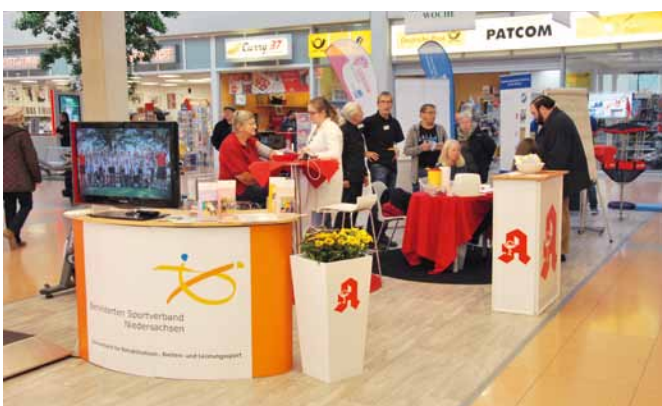
Auf der dritten Auftaktveranstaltung im Kauf Park Göttingen war der Aktionsstand gut besucht.