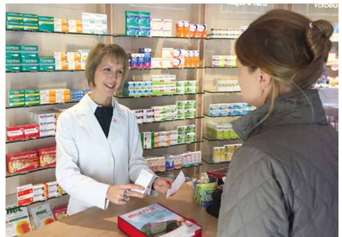
Anlaufstelle und Wegbegleiter: In der Apotheke können sich Parkinson-Betroffene sich über Hintergründe der Erkrankung und Therapiemöglichkeiten beraten lassen. Besonders wichtig ist die Therapietreue, denn nur so kann die Behandlung gelingen und Symptome und Beschwerden lindern.

Im Verlauf der Erkrankung können zudem Beschwerden erneut, aber auch ganz neu auftreten. Die Gründe hierfür können vielfältig sein: Die Er-