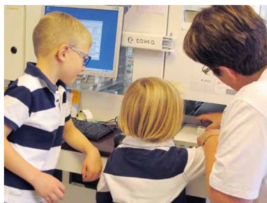
Staunten über die Technik: „Maus-Fans“ bei der Ausgabestelle des Kommissionierautomats der St. Georg-Apotheke in Celle.

Am Tag der Deutschen Einheit hatte die St. Georg-Apotheke ganz besonderen Besuch: Fans von der „Sendung mit der