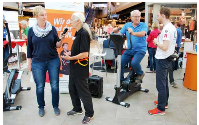
Viel los am Aktionsstand in Hannover: Interviews zu den Themen Sport und Diabetes mit den Initiatoren, Fitnessangebote und Gesundheitschecks.