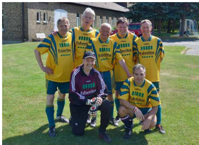
Das Ü45-Team des LAV Niedersachsen e.V.: Hart gekämpft und trotz verletzungsbedingtem Spielerausfall glücklich den fünften Platz errungen.

Sachsen und Hessen gingen verloren. Für das Team bedeutete das den letzten Platz