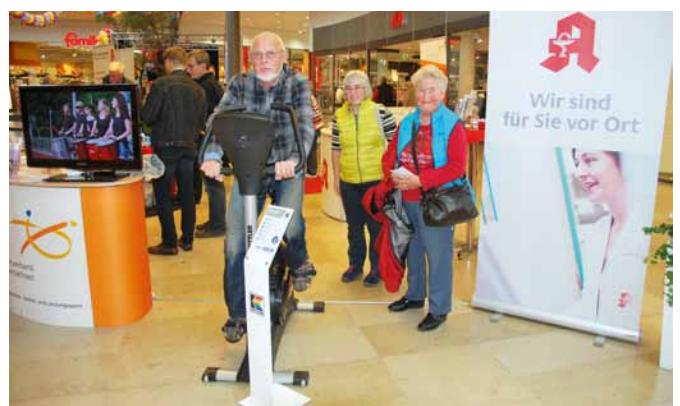
Radeln gegen den Zucker: Auch in Oldenburg stiegen die Besucher auf ein Fitnessgerät und ließen vor und nach dem Sport ihren Blutzuckerwert überprüfen.