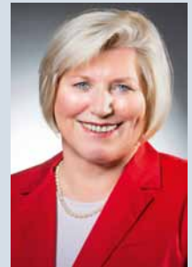
Cornelia Rundt Niedersächsische Ministerin für Soziales, Gesundheit und Gleichstellung