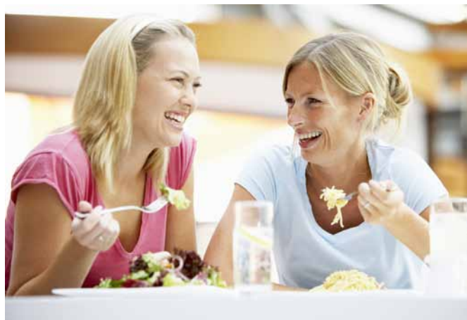
Laut der Nationalen VersorgungsLeitlinie Therapie des Typ-2-Diabetes ist neben mehr Bewegung auch eine Ernährungsumstellung bei Diabetes Behandlungsmethode Nummer Eins. Deren Wirksamkeit unterschätzen viele Patienten und müssen deshalb oft gezielt motiviert werden.

Neuropathie, die in ein diabetisches Fußsyndrom münden kann. Da Nerven unter anderem durch einen anhaltend hohen Blutzucker geschädigt werden, spüren Diabetiker Verletzungen an den Füßen nicht, was zu schlecht heilenden Wunden führen kann. Dennoch tritt häufig gleichzeitig auch ohne Verletzung ein anhaltender stechender Schmerz auf. Weniger bekannt ist, dass damit häufig auch motorische Störungen bis hin zu einer erhöhten Sturzneigung einhergehen, da die Muskulatur sich