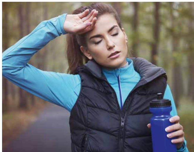
Trockene Haut, erhöhter Harndrang und starkes Durstgefühl: Zu Beginn der Krankheit sind es Symptome, die nicht sofort auf Diabetes hindeuten. Bleibt Diabetes unerkannt, kann dies für den Betroffenen gefährlich werden und zu Nervenschädigungen führen.

wendeten sich immer wieder Patienten mit „unerklärlichen Messwerten“ ratsuchend an ihn. Dann stellt sich beispielsweise heraus, dass doch ein minimaler Marmeladerest vom Frühstück der Grund war. Ein anderer berichtete von stets guten Werten zu Hause, nur unterwegs „spielten sie verrückt“. Der Grund: Der Patient, der beruflich viel unterwegs war,