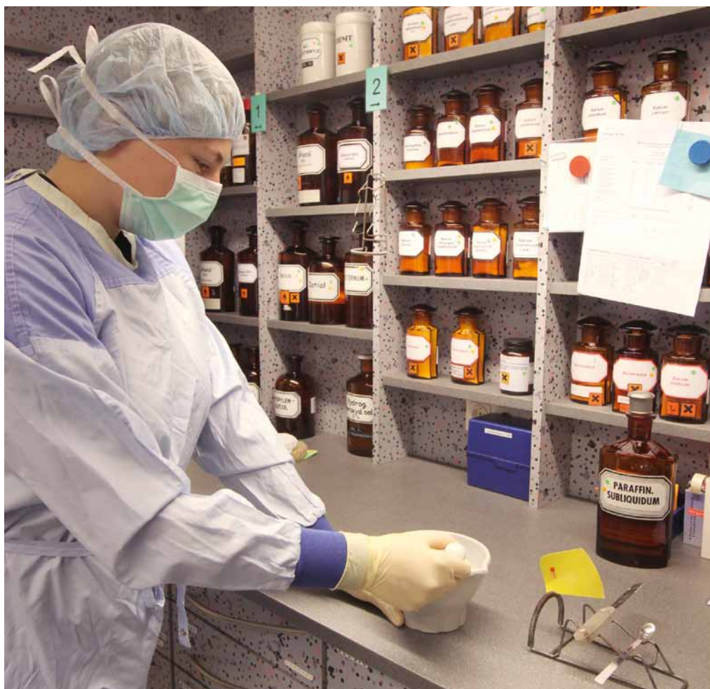
Hoher Aufwand: Die Erstellung individueller Rezepturen geschieht in deutschen Apotheken nach strengen Vorgaben und mit größter Sorgfalt. Dennoch wird derzeit die Versorgung mit individuell hergestellten Arzneimitteln inklusive der dazugehörigen Beratung schlechter vergütet als die Versorgung der Bevölkerung mit rezeptpflichtigen Fertigarzneimitteln. Das soll sich laut Entwurf des Arzneimittel-Versorgungsstärkungsgesetz (AM-VSG) endlich ändern.

Weil die Kassen nicht mehr bezahlen wollen, spielen sie auf Zeit. Man solle erst die Ergebnisse des vom Bundeswirtschaftsministerium initiierten Forschungsprojekts zum Apothekenhonorar abwarten. Dieses wurde im Frühjahr 2016 in Auftrag gegeben und dürfte frühestens 2018 en-